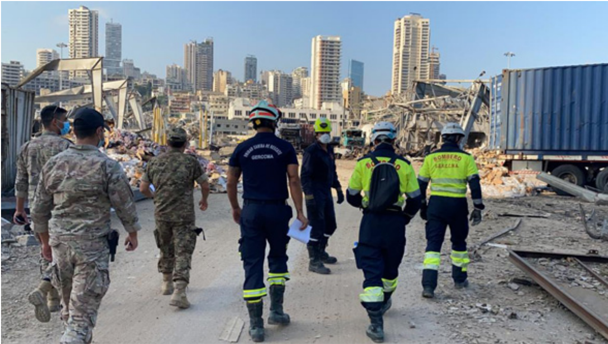
Los bomberos andaluces, acompañados por militares libaneses, en la Zona Cero de Beirut.

ver. En el casco de la ciudad, en la zona urbana cercana al puerto, pues también había algunos derrumbamientos que sí eran más similares a los que estábamos acostumbrados y pensamos desde un principio que era la zona donde podría haber más posibilidad de supervivencia.