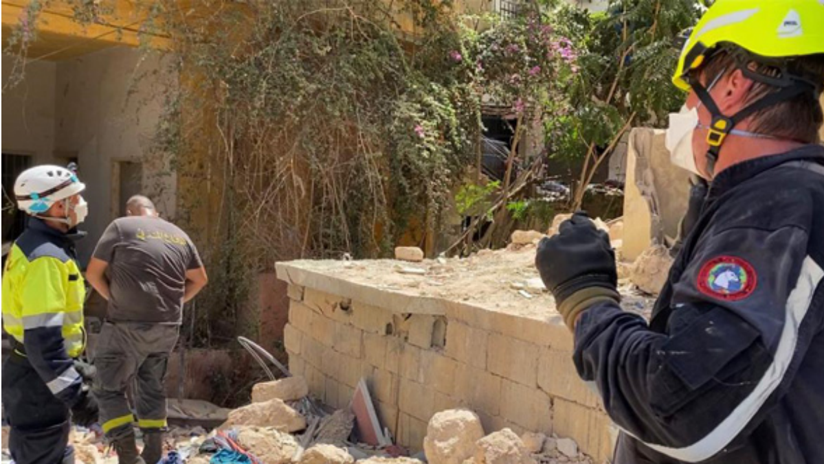
Los bomberos de Gercma durante las labores de rescate en Beirut.

no se extraen rápidamente, fallecen porque normalmente tienen traumatismos, tienen hemorragias. Hay que extraerlas lo más rápidamente posible para que puedan sobrevivir.