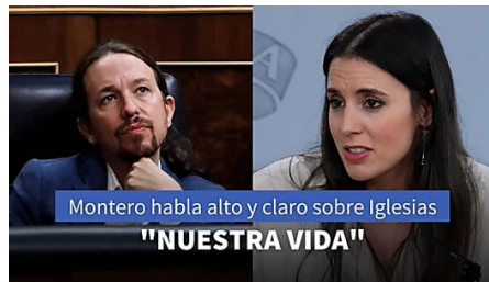
Irene Montero rompe su silencio y habla claro sobre la