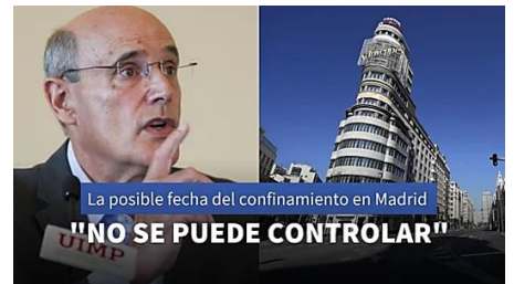
Un experto de la OMS pone fecha en Antena 3 al